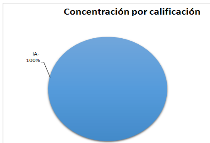
Riesgo contraparte (montos expresados en millones de pesos)